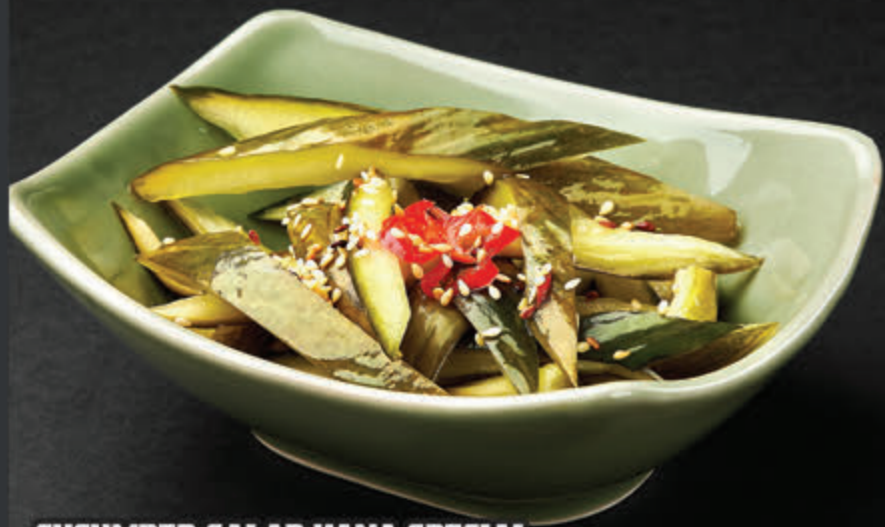
CUCUMBER SALAD HANA SPECIAL