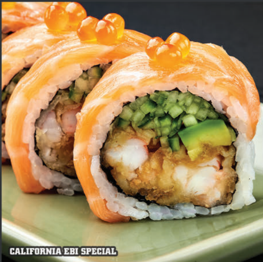
CALIFORNIA EBI SPECIAL