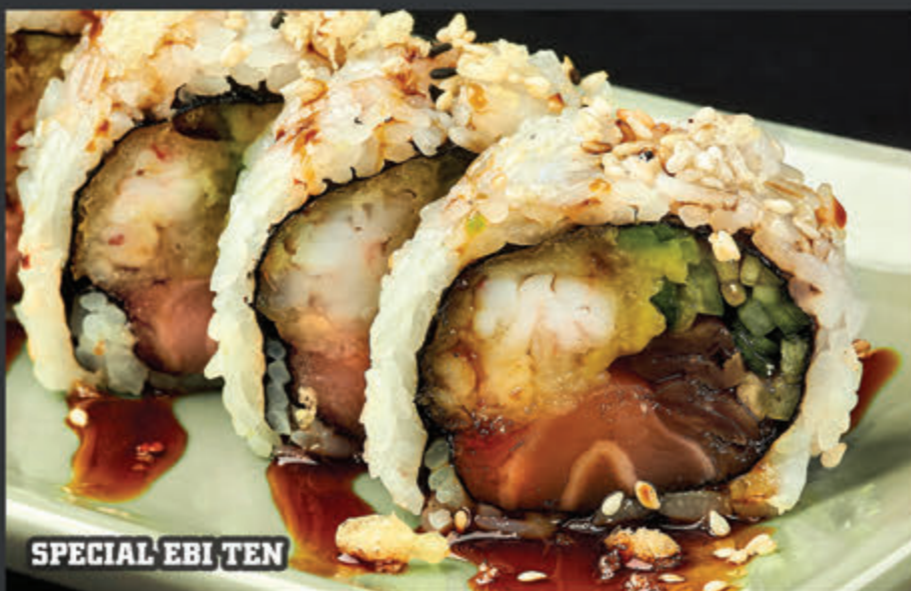
SPECIAL EBI TEN