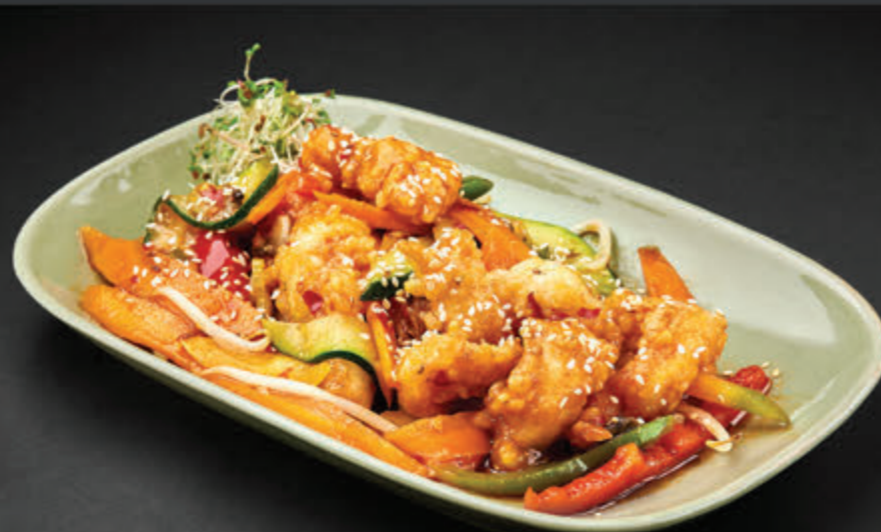
EBI SU LA