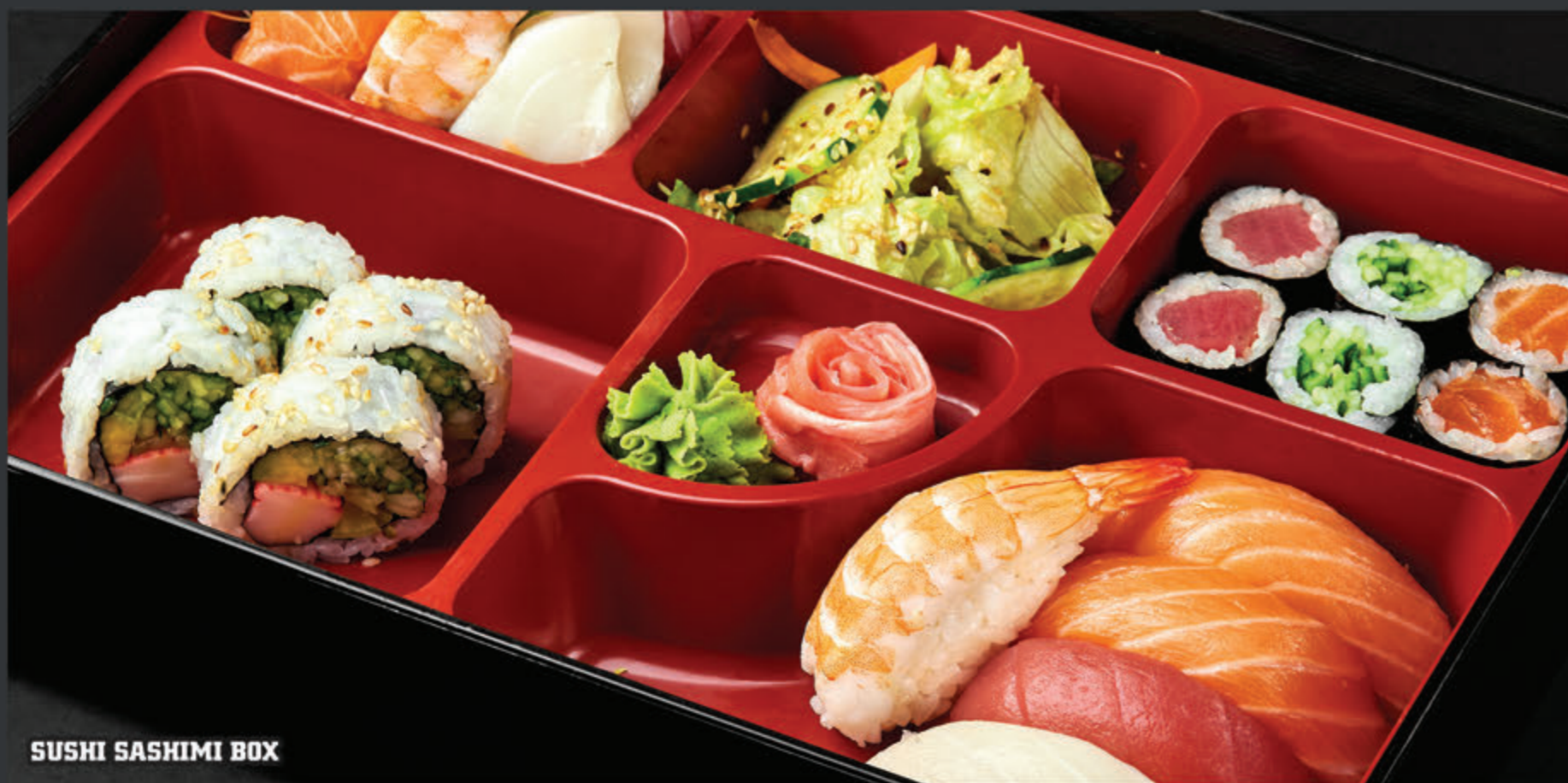
SUSHI SASHIMI BOX