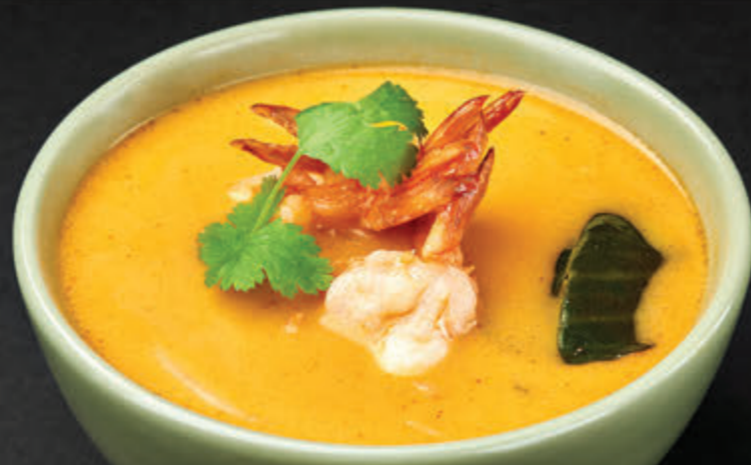
TOM YAM HANA