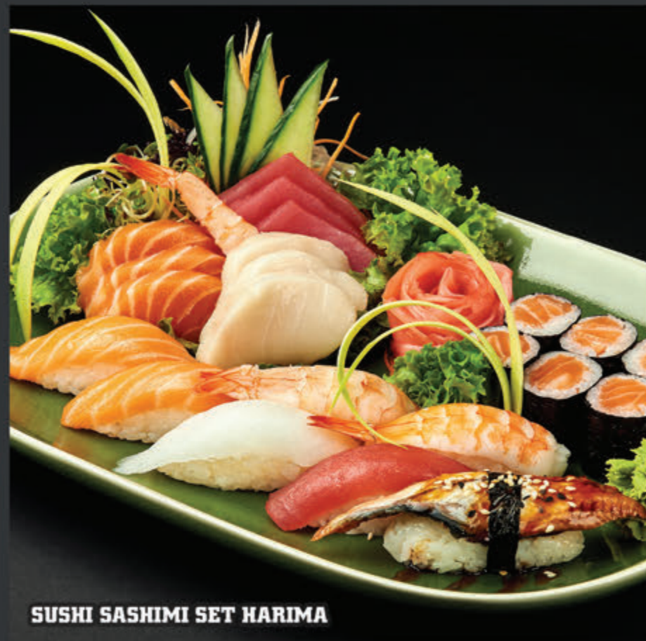
SUSHI SASHIMI SET HARIMA