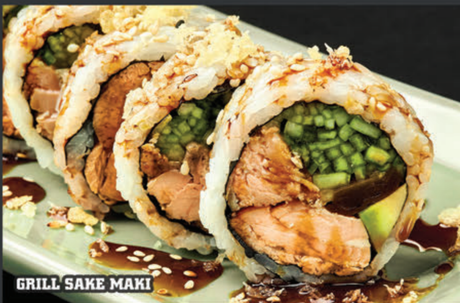
GRILL SAKE MAKI