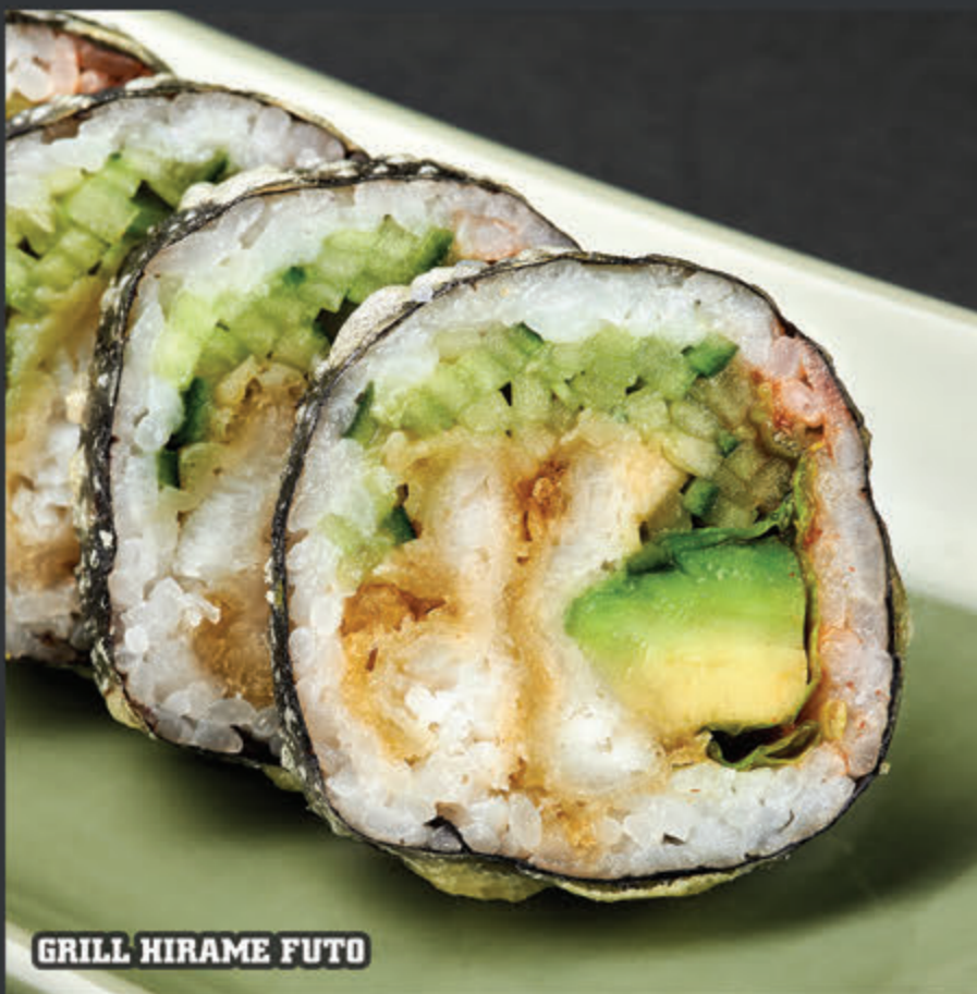
GRILL HIRAME FUTO