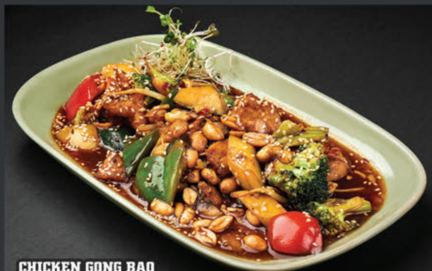
CHICKEN GONG BAO