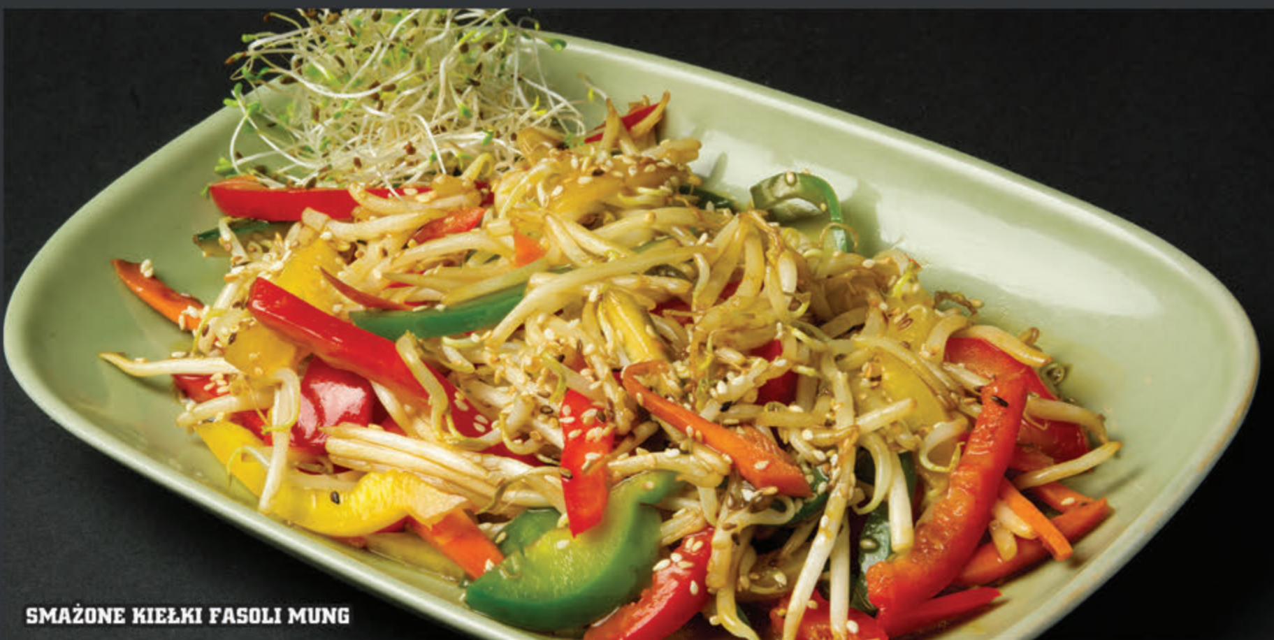
SMAŻONE KIEŁKI FASOLI MUNG