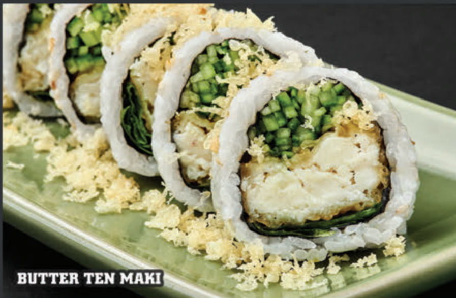
BUTTER TEN MAKI