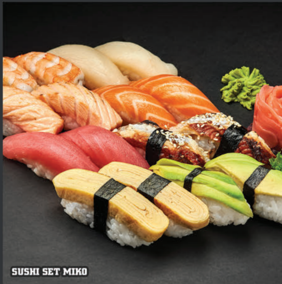
SUSHI SET MIKO