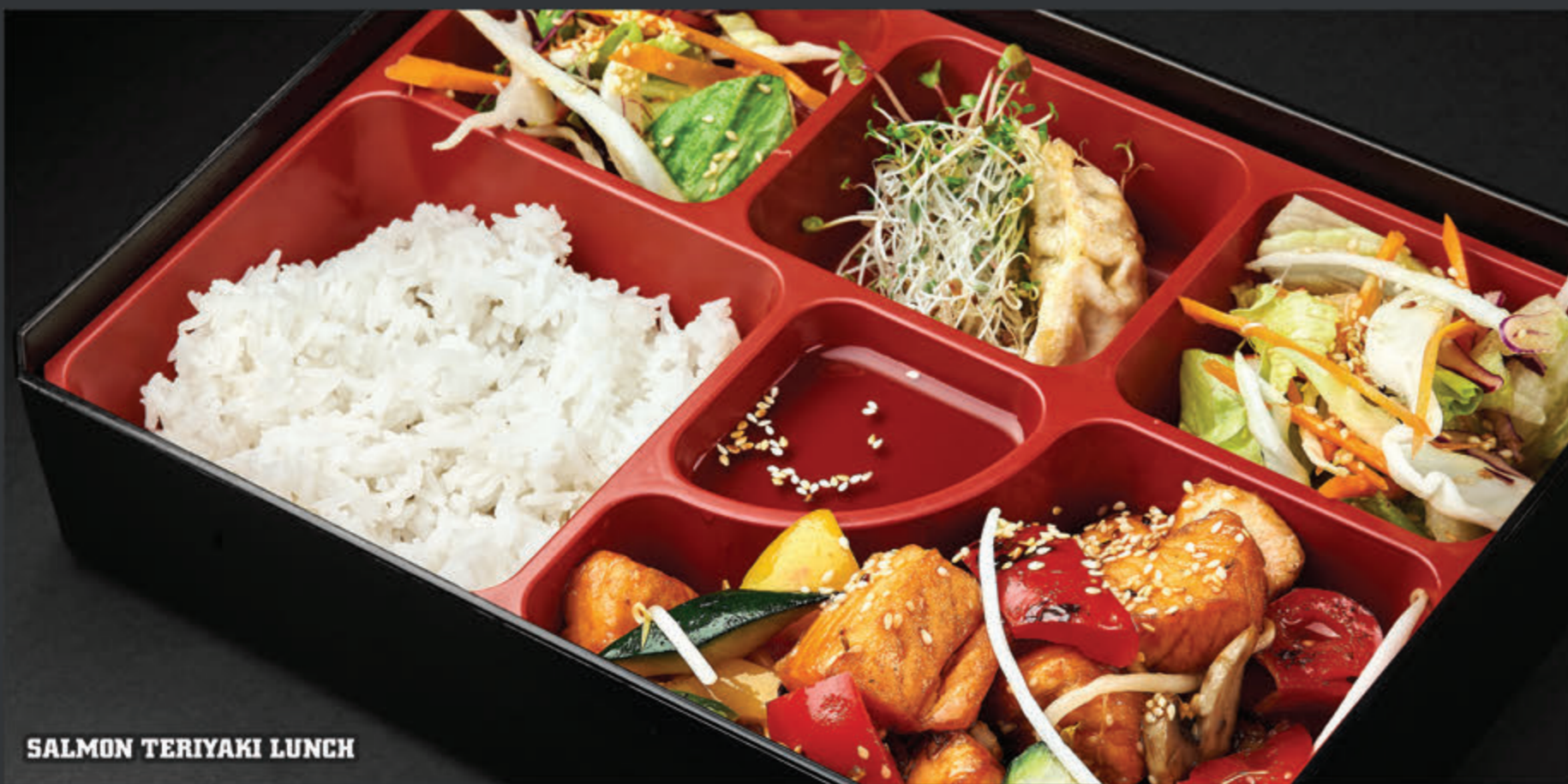
SALMON TERIYAKI LUNCH