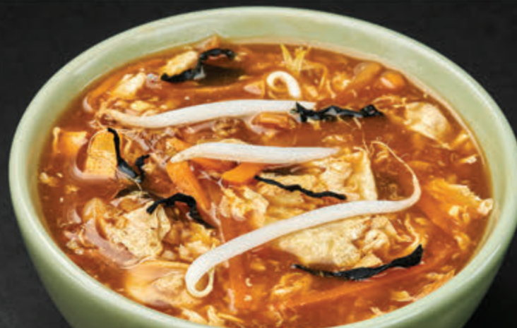
SUAN LA TANG