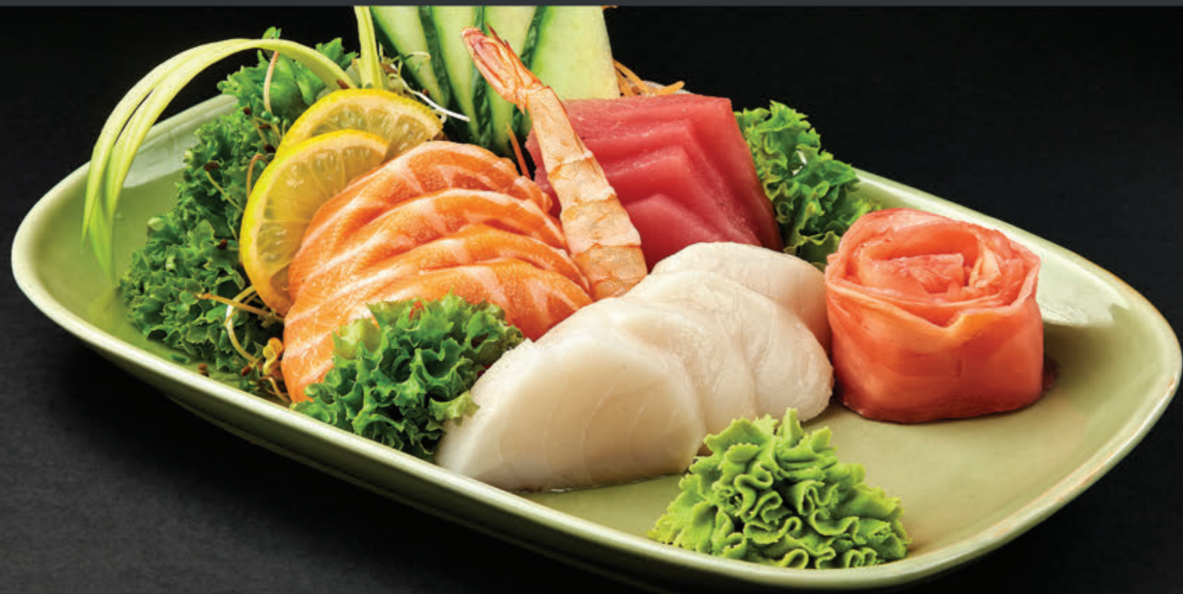
SASHIMI SET UME